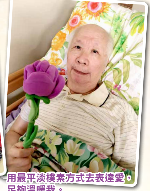
用最平淡樸素方式去表達愛，足夠溫暖我。