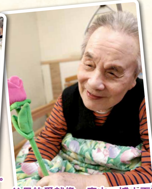
父母的愛就像一座山，博大而寬厚。