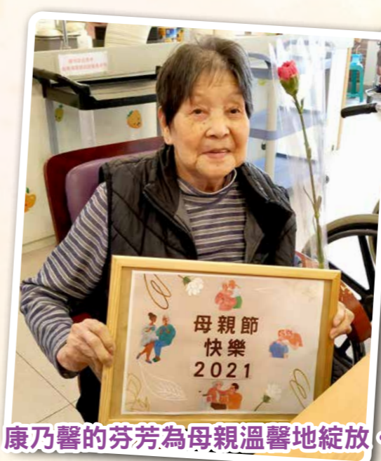
康乃馨的芬芳為母親溫馨地綻放。

疫情下無阻後輩們報答父母親們的養育之恩，除了藉著贈送鮮花及禮物，增添節日氣氛外，我們更一起頌讚每位父母親們，奉獻他們的一生為子女無私的付出和養育之恩。