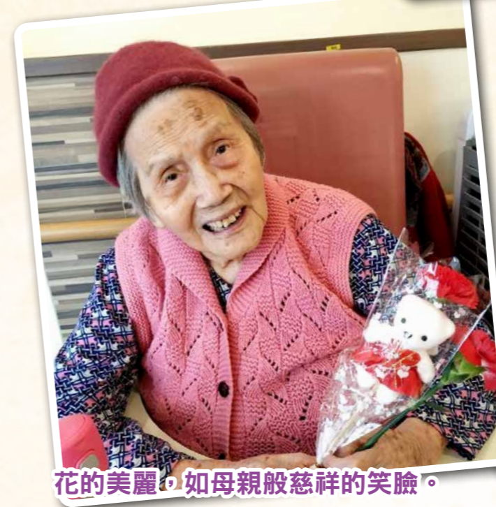
花的美麗，如母親般慈祥的笑臉。